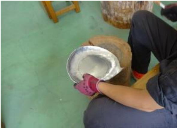
（前回）立体的な形になってきたところ