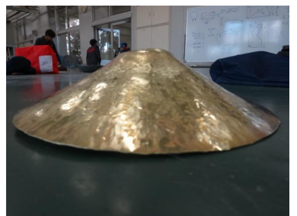
絞り加工を数回行いました