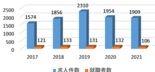
求人件数と就職者数の動向

毎年、就職希望者の数をはるかに超える多くの求人があり、狭山工業高校が長年の間に培ってきた信頼を物語っています。